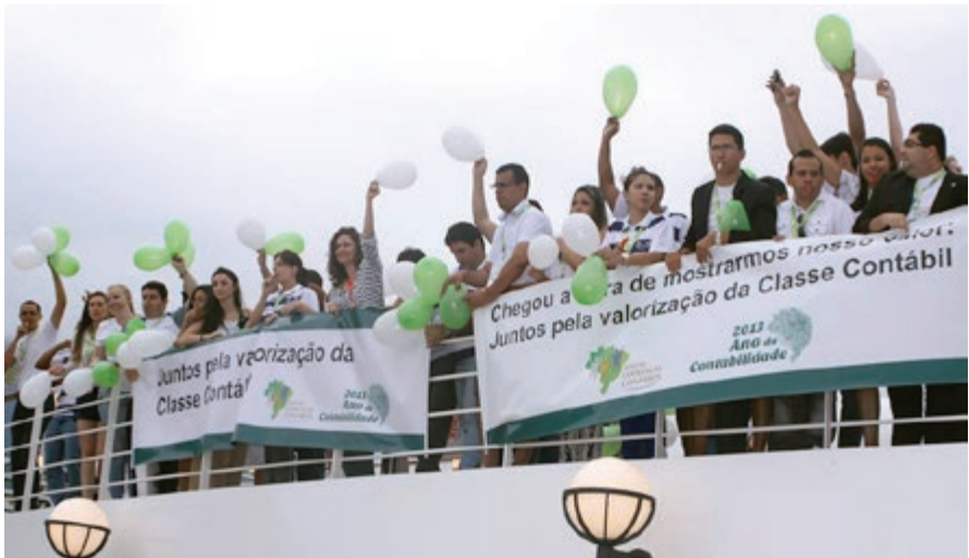
Participantes do 1º Encontro Nacional de Jovens Lideranças Contábeis, realizado em 2013.

“Só se chega a algum lugar quando se decide dar o primeiro passo.”