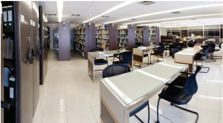
Biblioteca do CFC

A Biblioteca do CFC conta com obras que enfocam, específica ou correlativamente, assuntos relacionados à área contábil e a outros temas do CFC. O acervo possui mais de 16.500 itens bibliográficos.