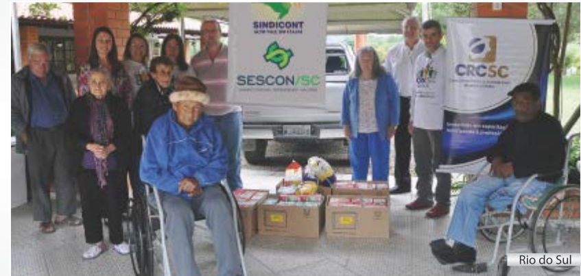
Rio do Sul