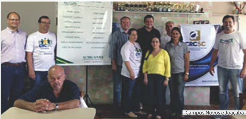
Campos Novos e Joaçaba