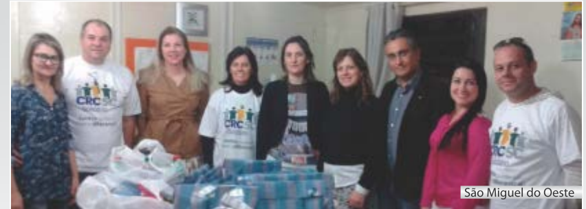
São Miguel do Oeste